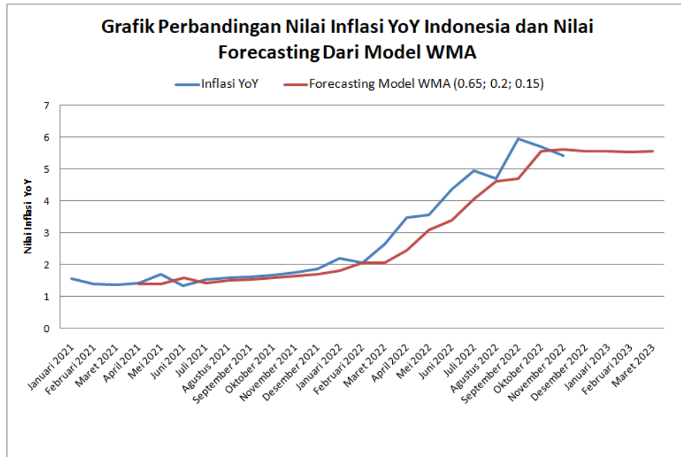
Gambar 3. Grafik Forecasting Nilai Inflasi YoY Indonesia Untuk Beberapa Bulan kedepan Dengan Metode WMA orde 3 (Bobot 0.65; 0.2; 0.15)

Dari Gambar.3 diatas, diperlihatkan perbandingan antara nilai aktual dan forecasting pada nilai inflasi YoY Indonesia. Dapat kita lihat bahwa nilai forecasting mengikuti nilai aktualnya, meskipun terlihat nilai forecastingnya berada dibawah nilai actual. Namun pada bulan Oktober 2022, terlihat bahwa nilai forecasting sudah sangat mendekati nilai aktualnya.dari hasil ini, penulis menyimpulkan bahwa metode weighted moving average (WMA) orde 3 dengan bobot (0.65; 0.2; 0.15) dapat digunakan untuk meramalkan nilai inflasi YoY Indonesia untuk beberapa periode kedepan.