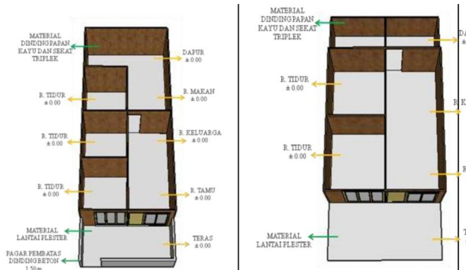
Gambar 4. Rumah Amatan di desa karangkembang

Berikut pada gambar 4 merupakan kondisi rumah pada desa Karangkembang yang Sebagian besar bergerak dibidang industry makanan, ruang yang digunakan adalah dapur. Untuk kegiatan pengemasan dilakukan di ruang keluarga. Adapun adaptasi penghuni rumah yang tidak terlibat tidak terlalu berpengaruh. Karena Sebagian besar aktivitas di lakukan di dapur, sedangkan mereka telah menyapkan tempat khusus untuk menyimpan makanan agar tidak perlu memasuki dapur.