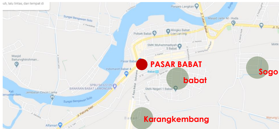
Gambar 1. Lokasi Pasar Babat