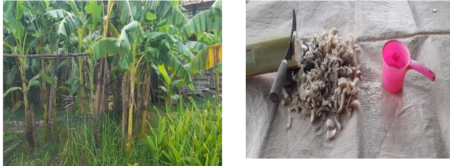
Gambar 2. Proses Pembuatan Pakan Ternak

kandidat tepat untuk pengganti pakan ternak. Jumlah protein kasar dalam batang pisang tidaklah terlalu tinggi namun dengan mencampur bahan lain seperti bekatul, bungkil kelapa, ampas tebu atau limbah dari produk gula, dan ditambah dengan fermentasi dapat meningkatkan protein kasar pada gedebog pisang.