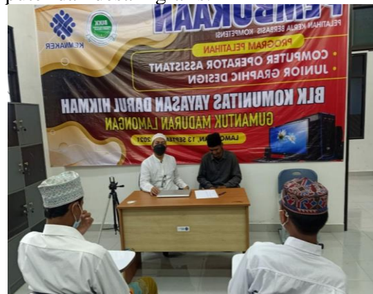
Gambar. 1 Pembukaan pelatihan oleh Kemnaker di Yayasan Darul Hikmah

pesantren dan organisasi yang berbasis keagamaan, hal ini merupakan salah satu faktor Penting dalam upaya pengurangan ketimpangan di tengah masyarakat. Upaya pemerintah ini dilakukan karena lembaga keagamaan telah mengakar kuat di tengah masyarakat terutama di wilayah perdesaan. Dari sebuah data menyebutkan bahwa terdapat sekitar 28 ribu pondok pesantren di seluruh Indonesia dengan jumlah santri lebih dari empat juta orang. Maka menurut wawancara dengan Ning Masruroh, seolah menangkap peluang tersebut, pengurus pondok pesantren Darul Hikmah desa Gumantuk, Maduran Lamongan ikut berpartisipasi dalam pengiriman Santri mengikuti kegiatan di Balai Latihan Kerja (BLK) dalam rangka pelatihan computer dan desain grafis.