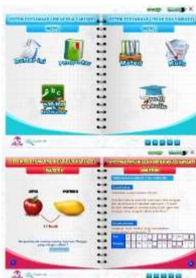
Gambar 3. Contoh Bagian e-book

Pada tahap penelitian ini, peneliti mulai membuat e-book matematika interaktif berbasis kontekstual. Data-data yang telah dikumpulkan selanjutnya di input ke dalam produk e-book matematika interaktif. Data tersebut berdasarkan flowchart dan storyboard yang dibuat sebelumnya. Penggunaan software komputer Adobe In Design CS6 dalam pengembangan e-book matematika interaktif dikarenakan software tersebut dapat mengemas e-book menjadi media pembelajaran yang menarik dan bersifat interaktif. Sehingga motivasi siswa dalam belajar lebih tinggi dari sebelumnya dan siswa dapat belajar dimana saja dan kapan saja. Berikut contoh media e-book matematika interaktif berbasis kontekstual.